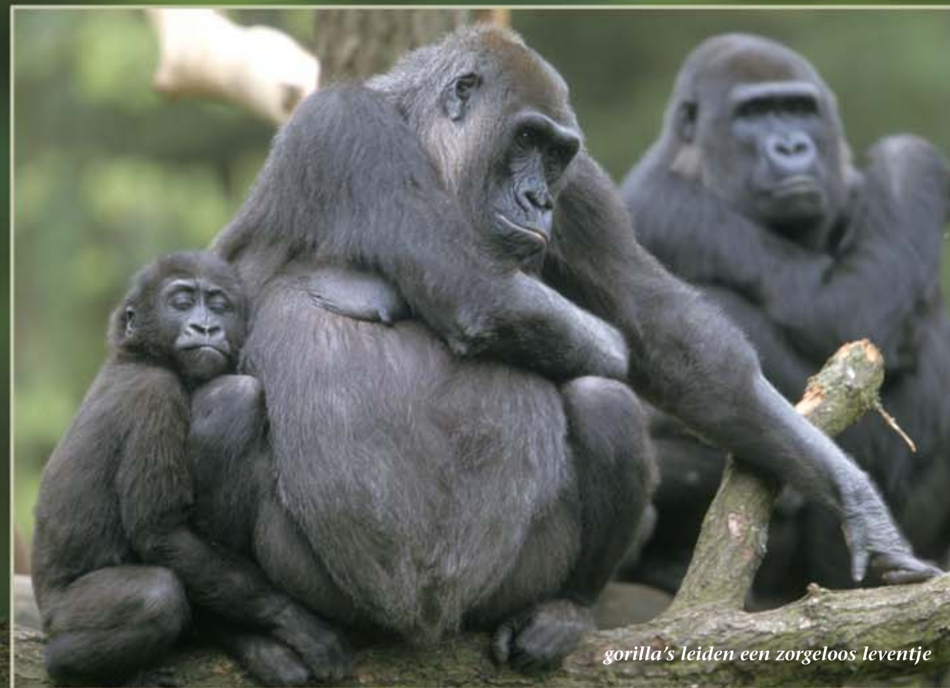
gorilla's leiden een zorgeloos leventje

Al met al legt een gorillagroep maar enkele honderden meters op een dag af, op z'n hoogst een kilometer. In het begin van de middag houden ze uitgebreid siësta. Terwijl de jongere gorilla's wat met elkaar spelen, rusten de volwassen dieren. Of ze onderhouden sociale contacten, bijvoorbeeld door elkaar te vlooien. Op het sein van de zilverrug gaan ze daarna weer verder. Bij het invallen van de schemering bouwt ieder van takken en bladeren een eenvoudig nest. Jongere dieren slapen 's nachts bij hun moeder.